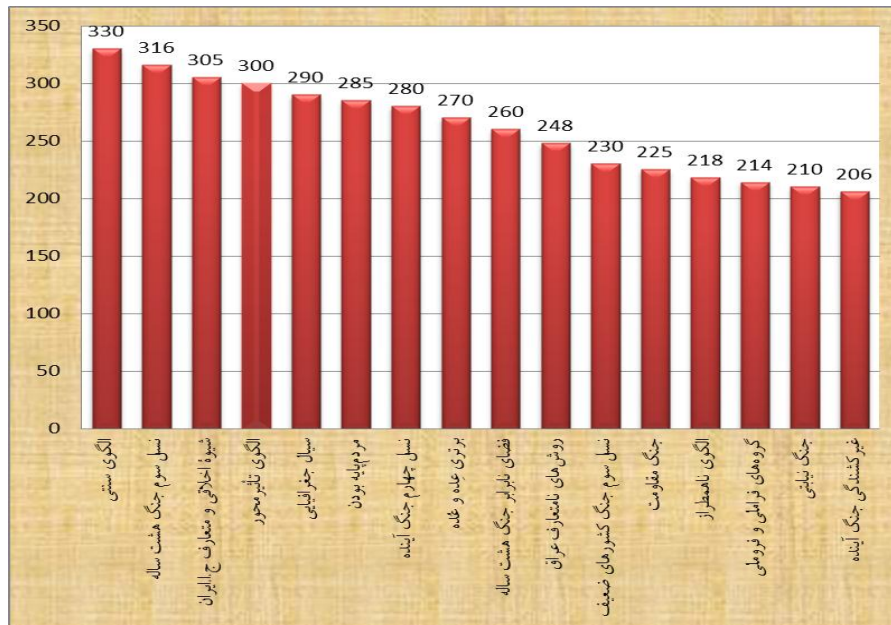
نمودار شماره ۱. تأثیرگذارترین عوامل طبق جدول شماره ۳